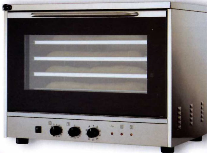
HORNO CONVECCION 4 BJAS. 60*40 (CON VAPOR)